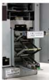
スライド式収納部(千円紙幣)