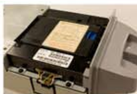
紙幣識別ユニット NB-4PS3

紙幣識別部には、パチンコ・ゲーム市場で約40万台の出荷実績をもつNB-4PS3を搭載。光・磁気併用識別方式による紙幣識別で高い偽札排除性能と安定した紙幣受入を誇ります。