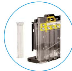
コインチューブは 工具不要で簡単交換